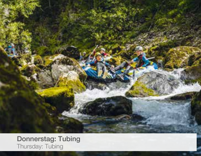
Donnerstag: Tubing Thursday: Tubing

Mit Schlauchreifen (engl. Tube) reiten wir den Fluss hinunter und machen in einer Bucht Pause zum „Gumpenspringen“. Wer schafft die Stromschnelle ohne umzukippen? Wer traut sich vom Felsen in die tiefen Becken zu springen? Bestens ausgerüstet mit Neoprenanzug, Helm und Schwimmweste schafft ihr alle Herausforderungen. Bitte bringt Badesachen und ein zweites Paar Schuhe, das nass werden kann, mit. Erst ab 12 Jahren möglich!